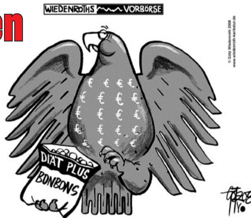
Fette Henne mit Naschzwang

Allein durch die jüngsten Diätenerhöhungen wären die