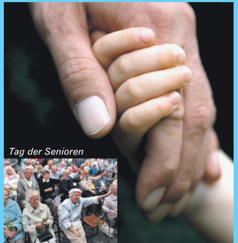
Tag der Senioren

Die Rentner sollen wieder einmal ausbaden, was Politiker verbockt haben. Das wollen wir ändern!